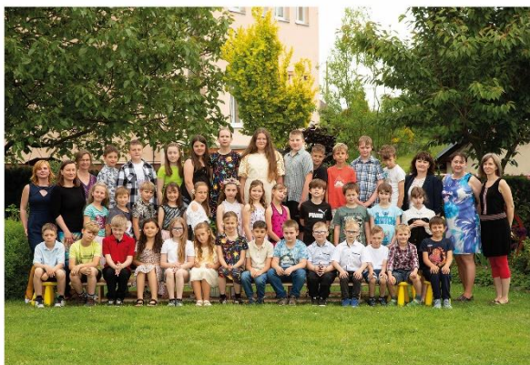
Základní škola Heřmanice u Oder školní rok 2024 - 2025